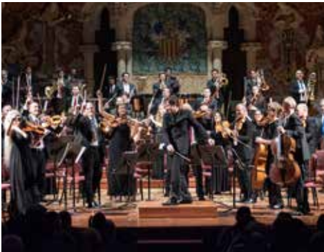
ORQUESTRA SIMFÒNICA DEL VALLÈS

És director titular de l'Orquestra Simfònica del Vallès i del Cor de Cambra de l'Auditori Enric Granados de Lleida, i director principal del Cor de Cambra del Palau de la Música Catalana i de l'Orquestra de Girona. Ha estat director assistent de la Jove Orquestra Nacional d'Espanya (JONDE) i de l'Orquestra Simfònica de Barcelona i Nacional de Catalunya (OBC). Ha estat director convidat en nombroses orquestres del país, amb una vinculació especial amb l'Orquestra Terrassa 48. És professor d'orquestra i direcció a l'Escola Superior de Música de Catalunya (ESMUC) i dirigeix el Curs de Direcció d'Orquestra de Terrassa des del 2017.